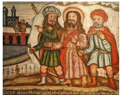
Auf dem Weg nach Emmaus, Gemälde von Lars Gallenius, 1684, Raah Church – National Museum of Finland.