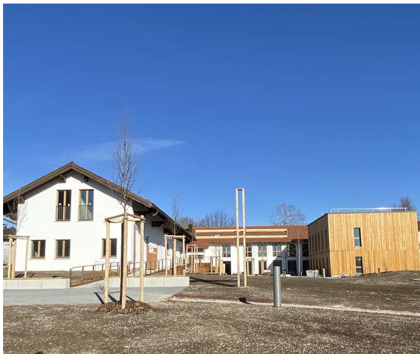
St. Josef Holzkirchen – Frisch renoviertes Pfarrheim und neues Verwaltungsgebäude Einweihungsfeier am 27.04.2025