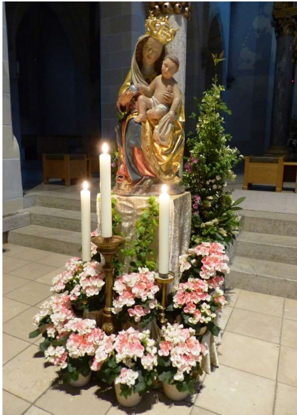
Foto: Madonna in der Abteikirche St. Ottilien Wunibald Wörle, Pfarrbrief.de