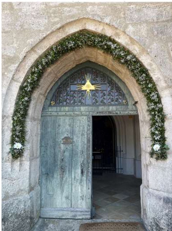
Frauenkirche Osterwarngau